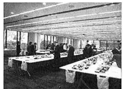
<昨年度の審査風景>